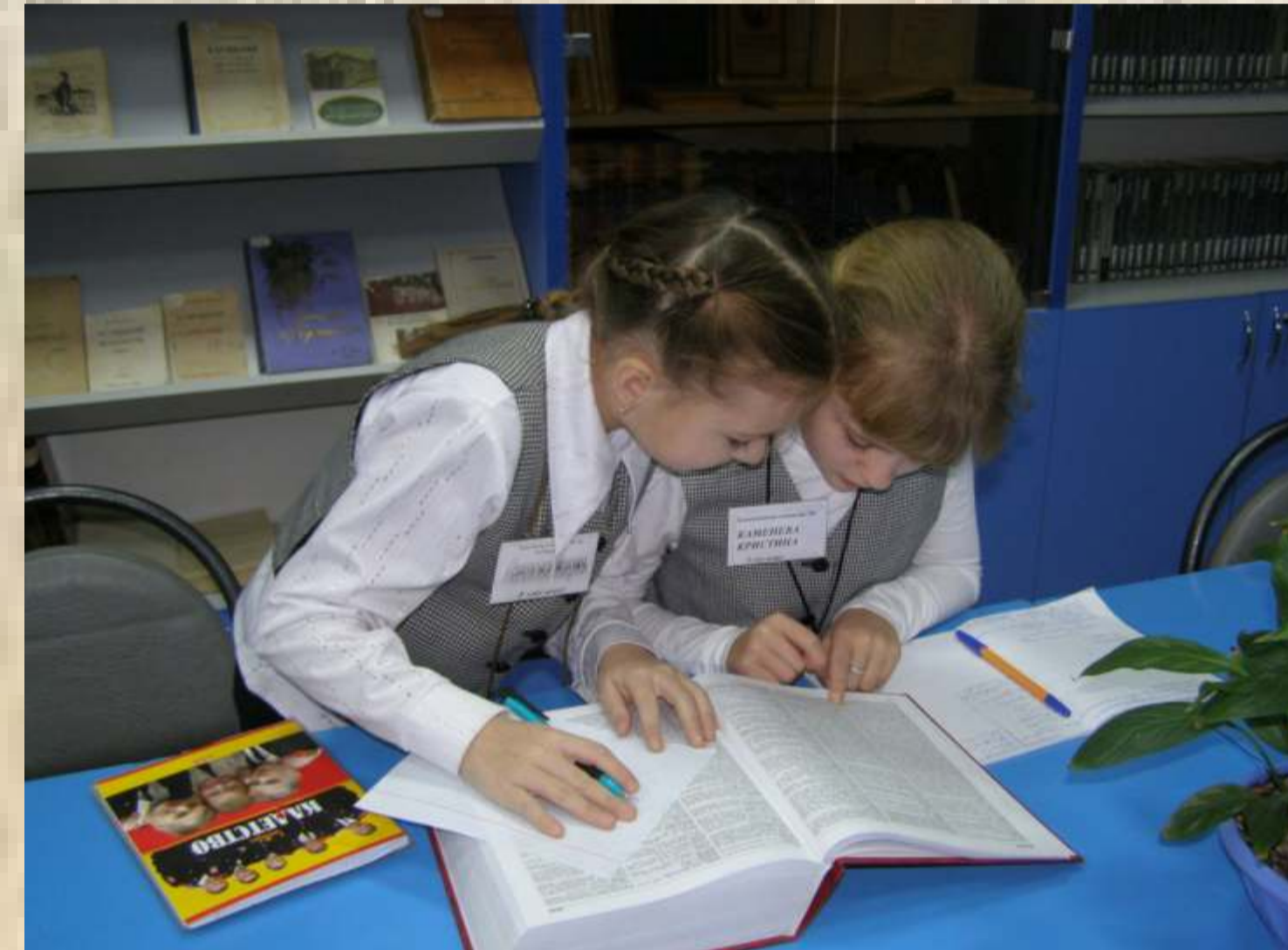
Работа с традиционными источниками информации