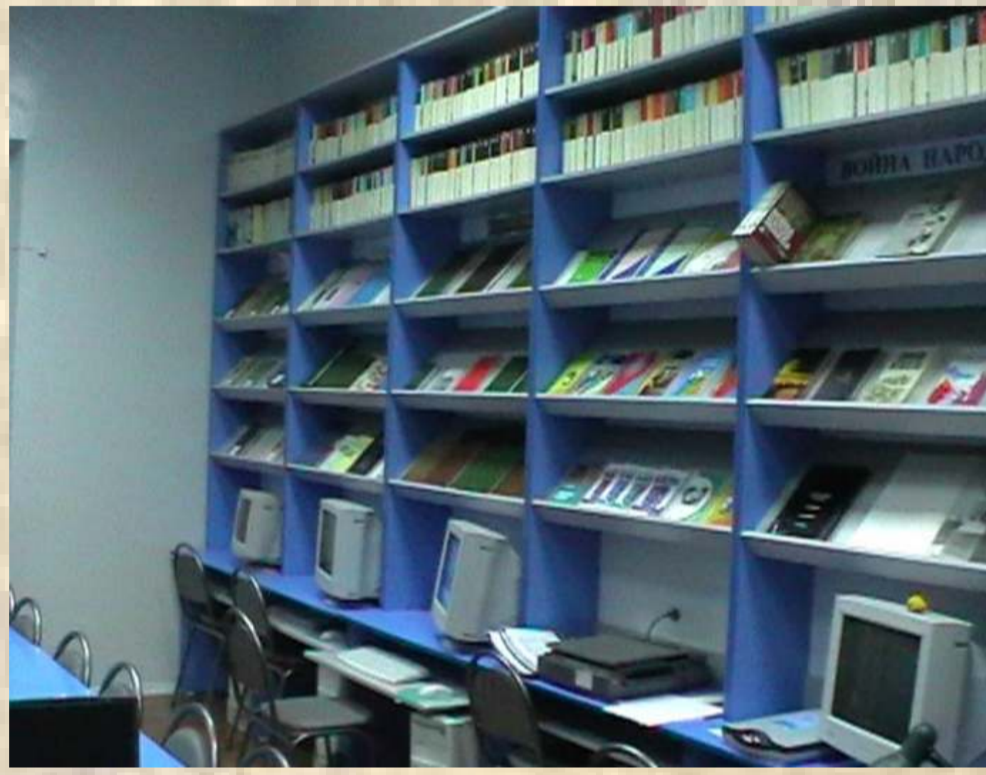
Оснащение компьютерной и копировальной техникой

“Библиотека гимназии - единый координационный центр информационного пространства гимназии”)