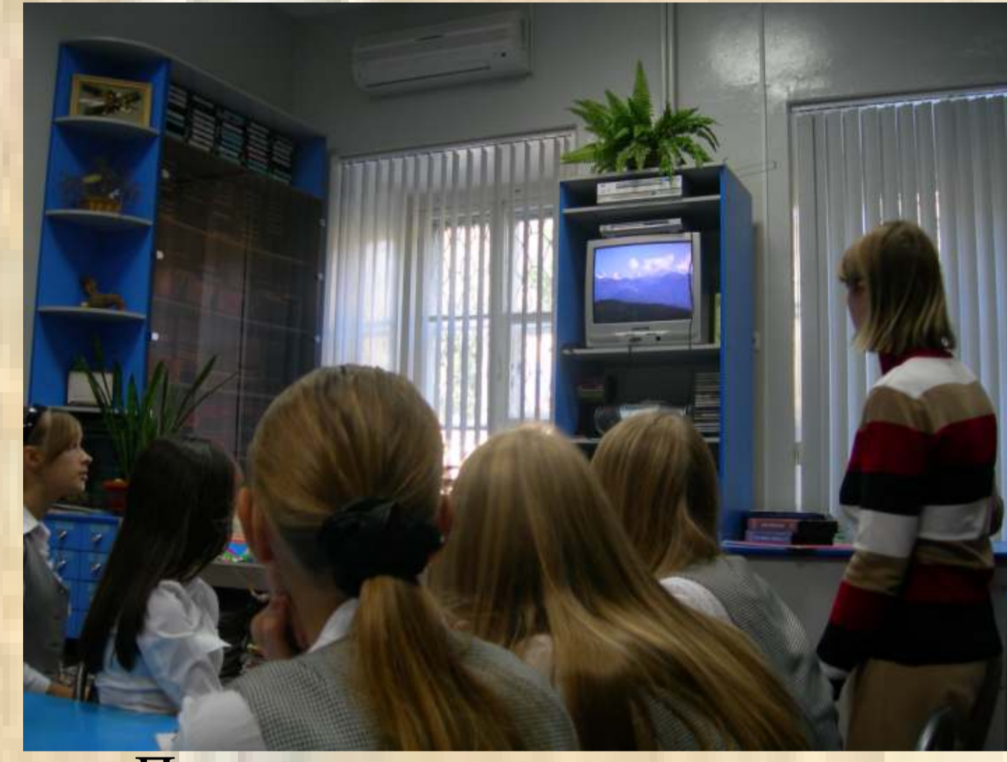
Проведение уроков с использованием видеотехники и мультимедийных пособий