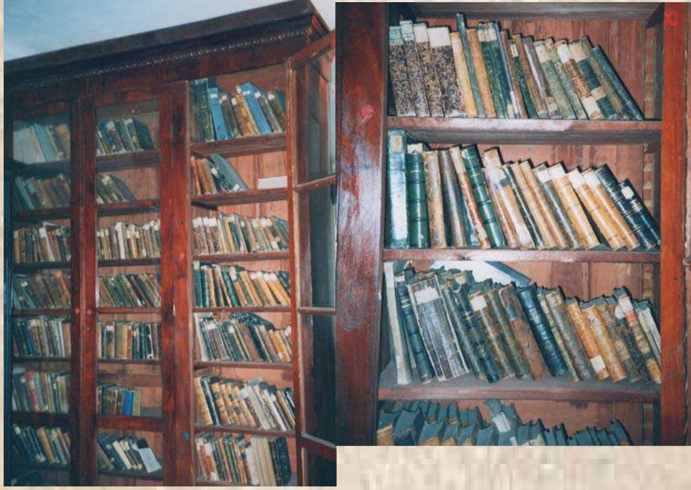
Библиотека 1-й мужской гимназии 1806 г. (реставрация в экспозиции музея-читальни И.Н. Ульянова)

Сегодня библиотека насчитывает более 26000 экземпляров художественной, научно-познавательной и справочной литературы. Имеются электронные издания. Библиотека представляет собой хорошо оснащенный документально и технически информационный центр.