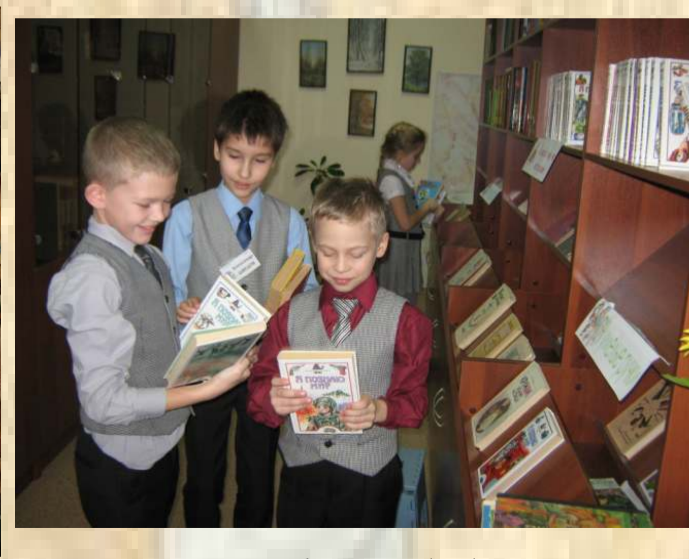
Помещение фонда библиотеки после ремонта 2014 г.