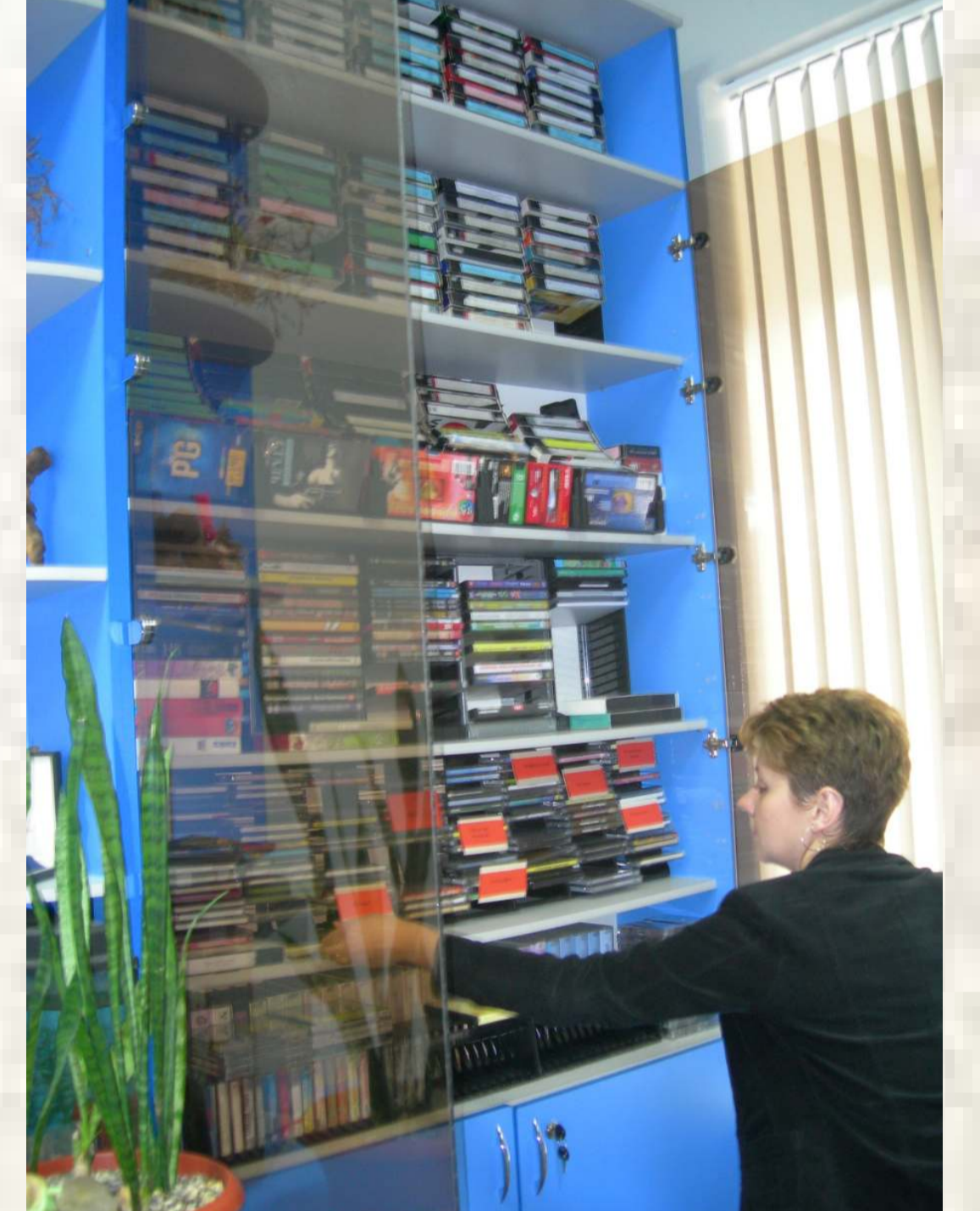
Работа с электронными источниками