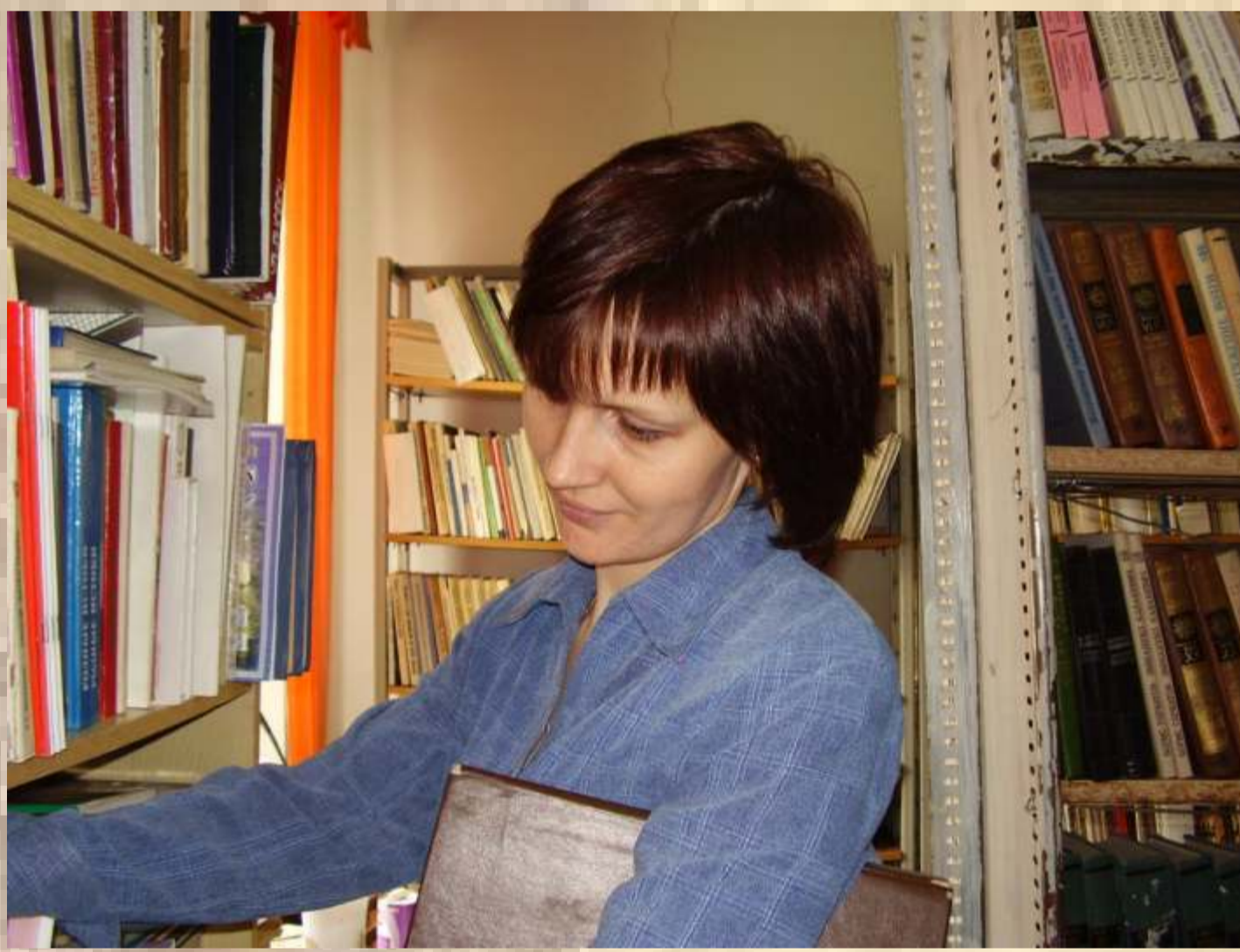
Помещение фонда библиотеки до ремонта 2014 г.