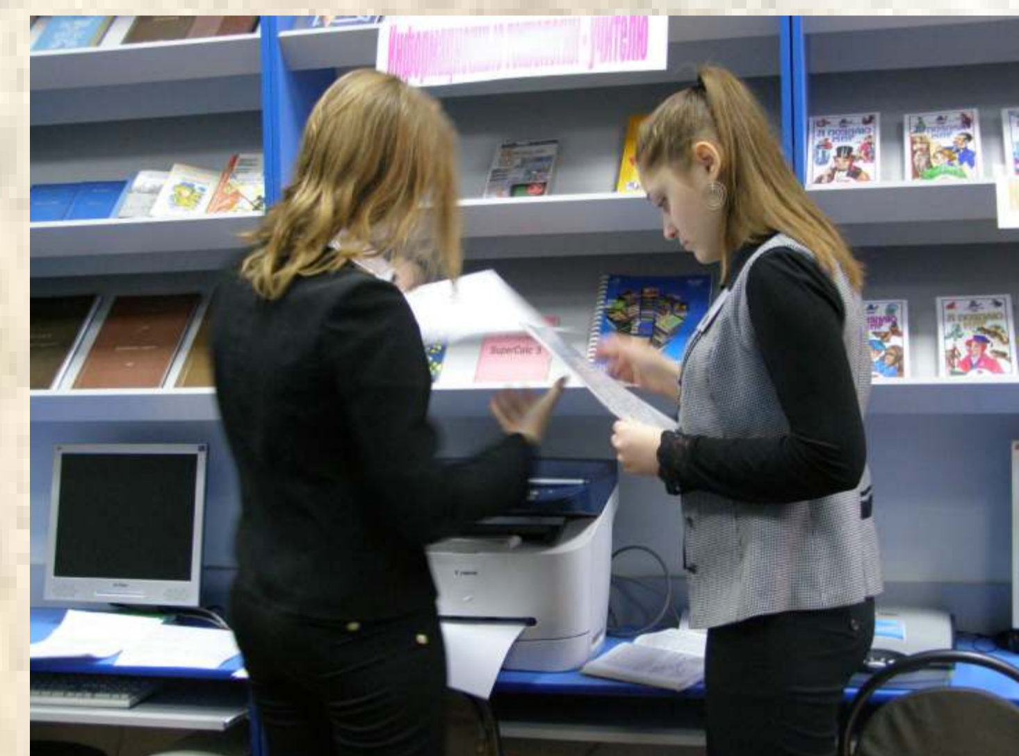
Копирование и тиражирование необходимой информации