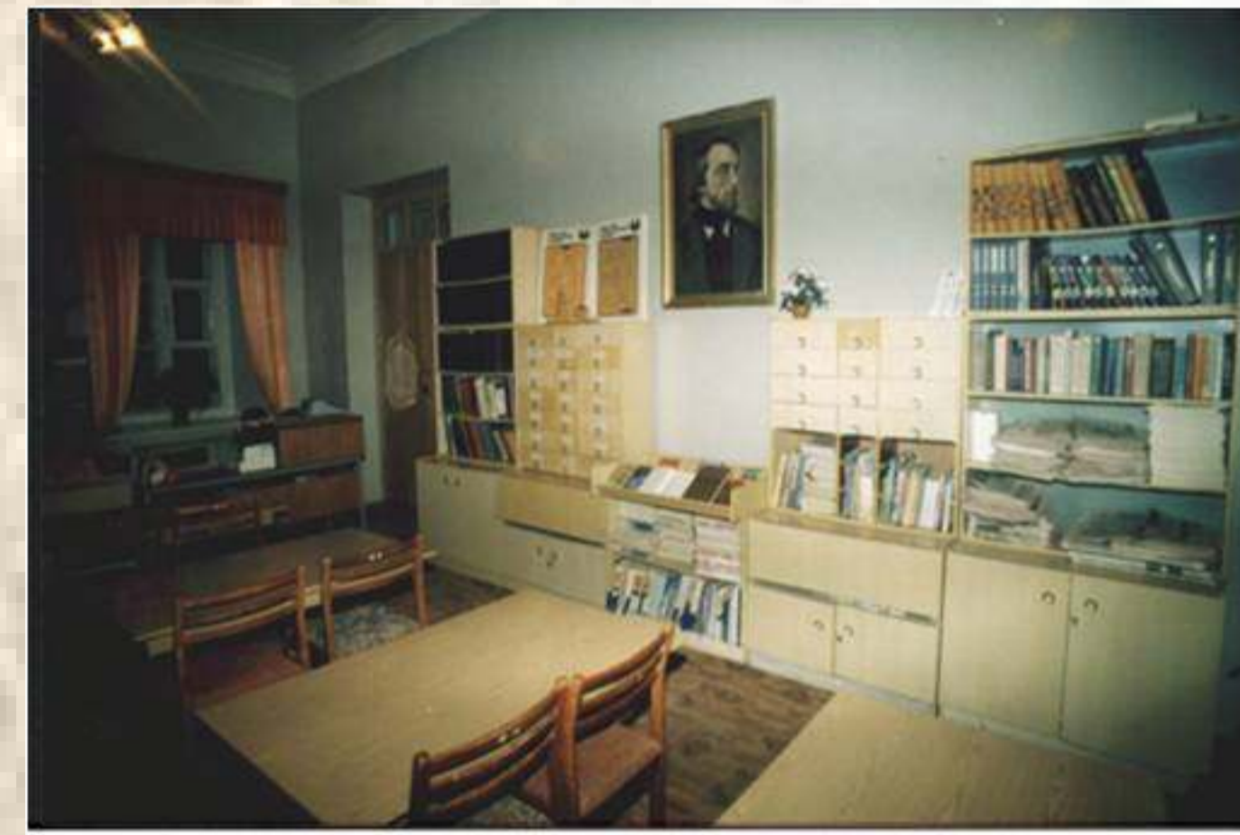
Библиотека гимназии №1 им. В.Г. Белинского (1991 - 2004 после капитального ремонта здания гимназии)