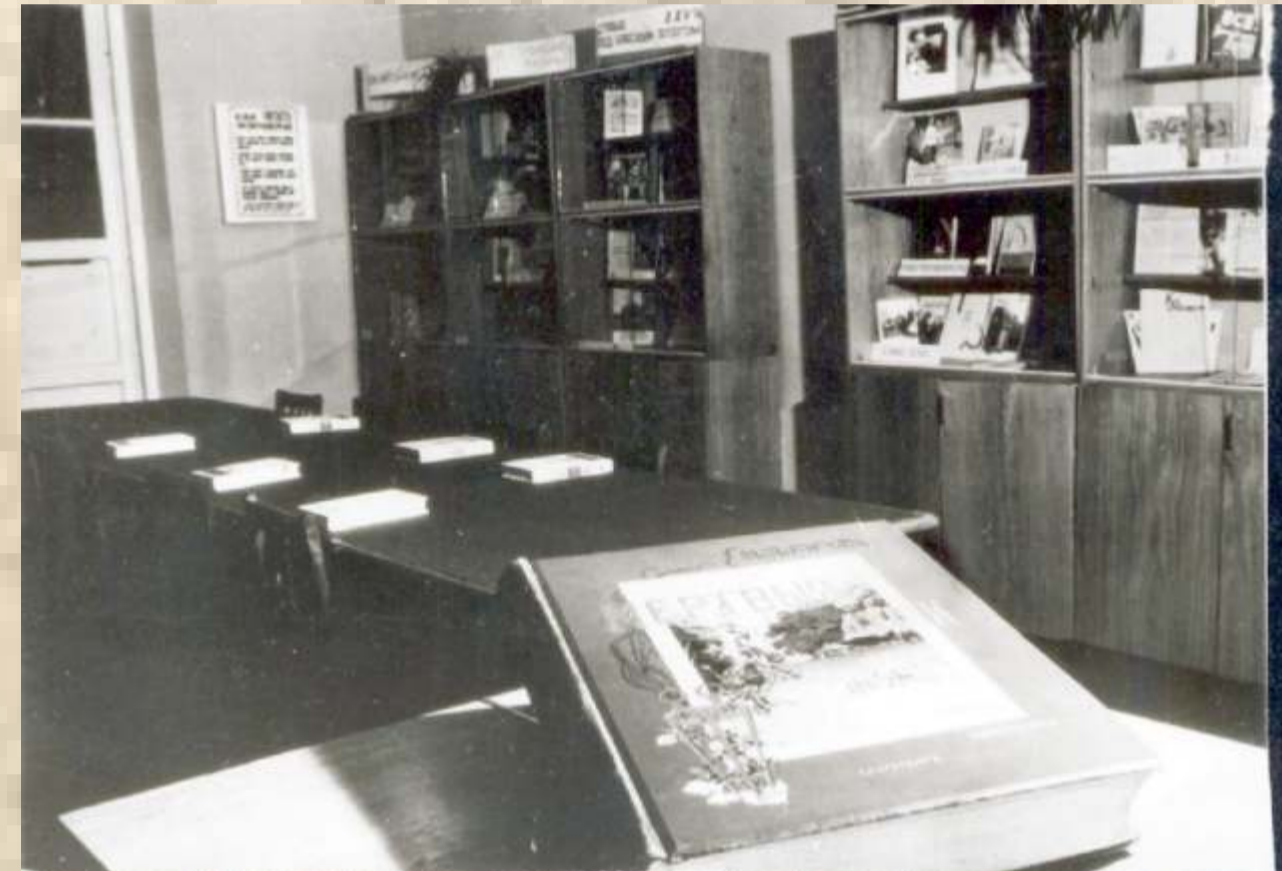
Библиотека школы №1 им. В.Г. Белинского (1960 - 1988 годы)