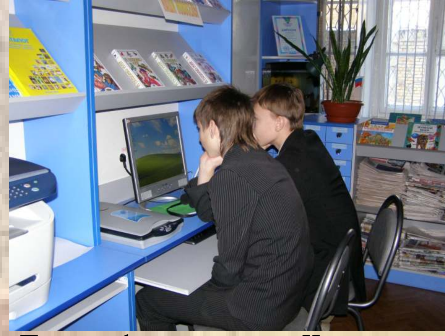
Поиск информации в сети Интернет, создание вторичных документов и презентаций